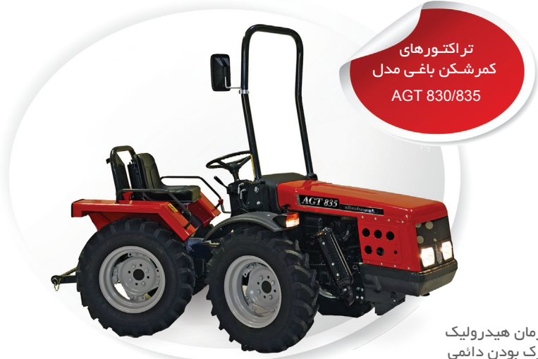
تراکتورهای کمرشکن باغی مدل AGT 830/835