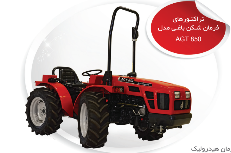
تراکتورهای فرمان شکن باغی مدل AGT 850